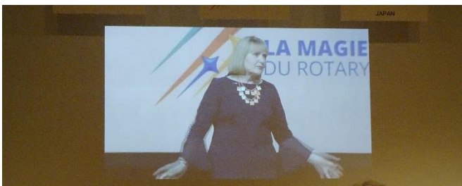
RI 会長ビデオメッセージ