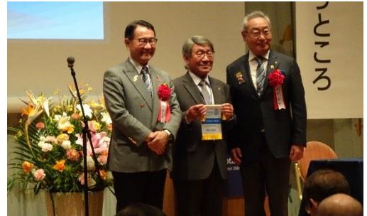
2023-24 年度 R 財団 1 人当たり寄付額優秀クラブ第 1 位 次年度地区大会ホストクラブへ 大会旗の引き継ぎ ホスト: 中信第二グループ